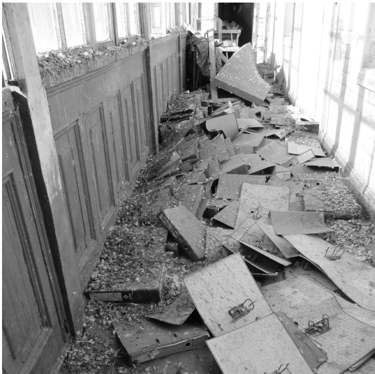
Los archivadores vacíos fueron la antesala de los preciados documentos históricos y una advertencia de lo que podría ocurrirles.