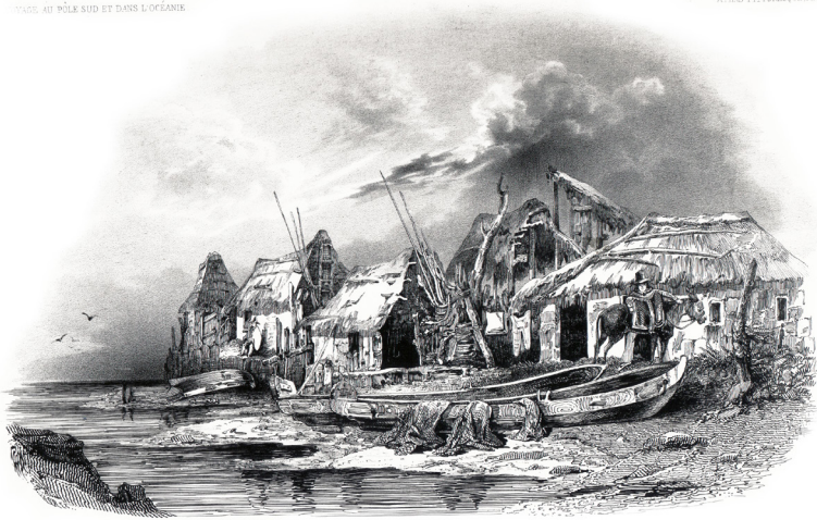
Cases sur la Plage de Talcahuano. 1844.