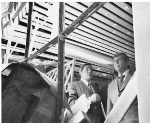
En una visita al inmueble, autoridades de la U. San Sebastián (foto), el Consejo de la Cultura y del municipio de Talcahuano conciben en la importancia de la preservación histórica para construir un futuro con orgullo e identidad.

Según explicó Cartes, el material se salvó de milagro, pues estos archivos suelen estar en un