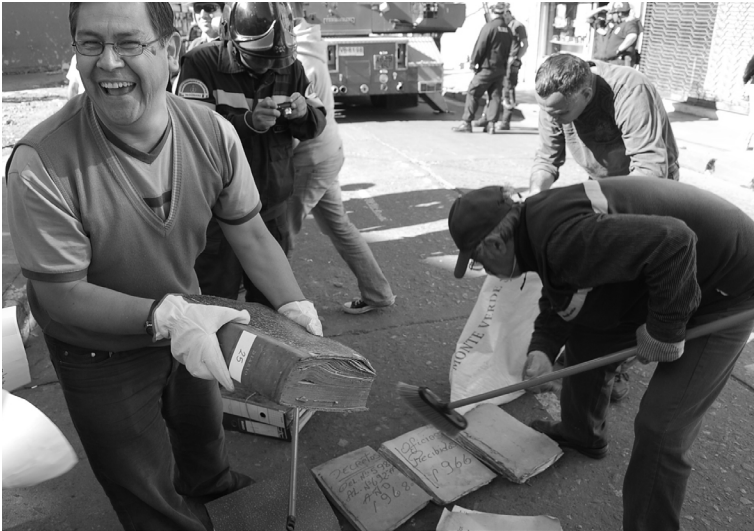
26 Medio centenar de personas acudió al operativo de rescate, funcionarios municipales, bomberos, carabineros y personal de la USS.