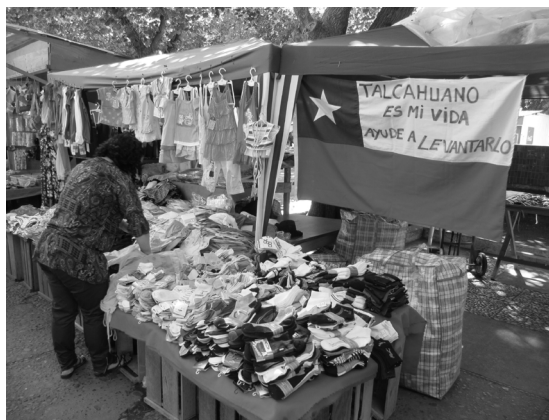
Los efectos de la catástrofe se veían en las calles de Talcahuano. Arriba, 52 embarcaciones quedaron varadas en las calles. Al centro, el edificio municipal, que debió ser demolido. Abajo, un año después del terremoto el pequeño comercio se mantenía en la Plaza de Armas.