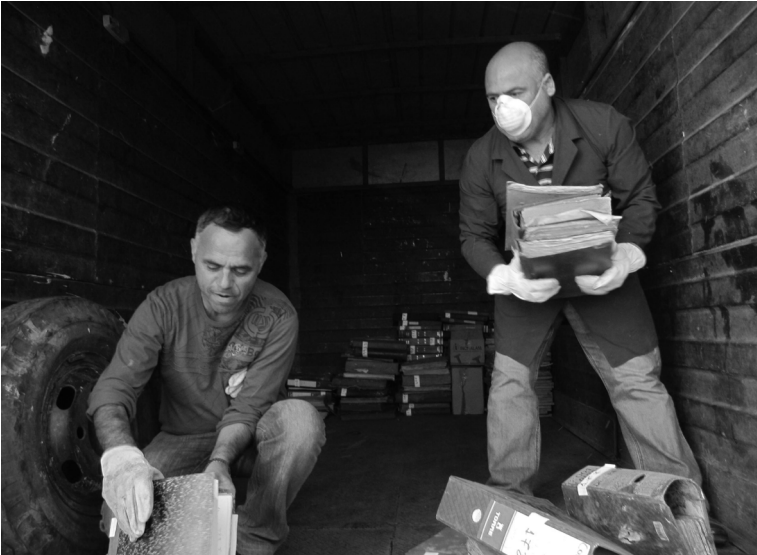
En un camión de la empresa ISS los archivos partieron a su destino temporal en la Universidad San Sebastián.