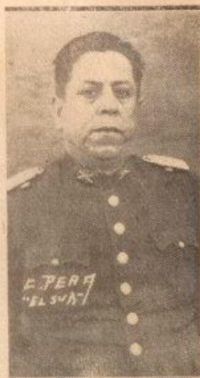
Comandante Egidio Moscoso

mandante Moscoso y espera que su permanencia en Concepción se prolongue por muchos años más.