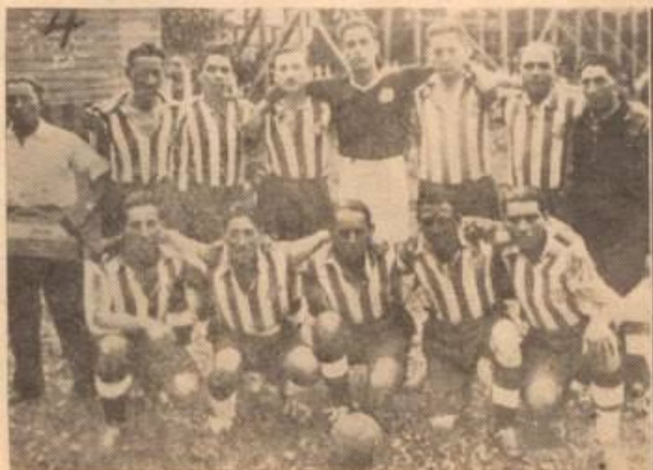
EL PRIMER EQUIPO DEL INDUSTRIAL EN 1936

Repetimos pues nuestros parabienes en la fecha que hoy celebra Industrial. Lo saludamos con sinceridad y afecto y hacemos votos muy fervientes para que el ya histórico club del barrio de Pedro de Valdivia, prosiga en su marcha ascendente para honra de sus colores y también para glorias del deporte local de todos los tiempos".