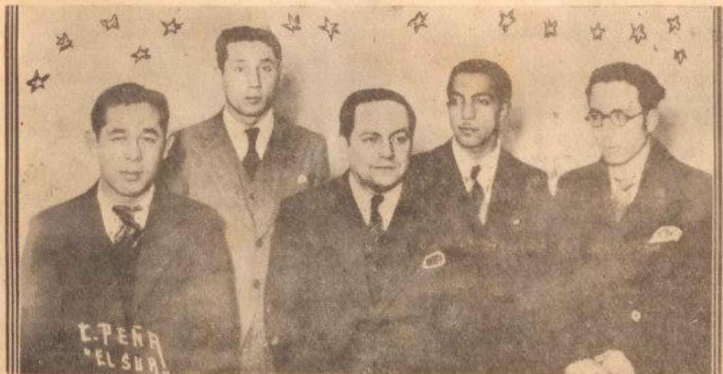
EQUIPO A, DE "EL SUR", CAMPEON DE PING-PONG DE CONCEPCION