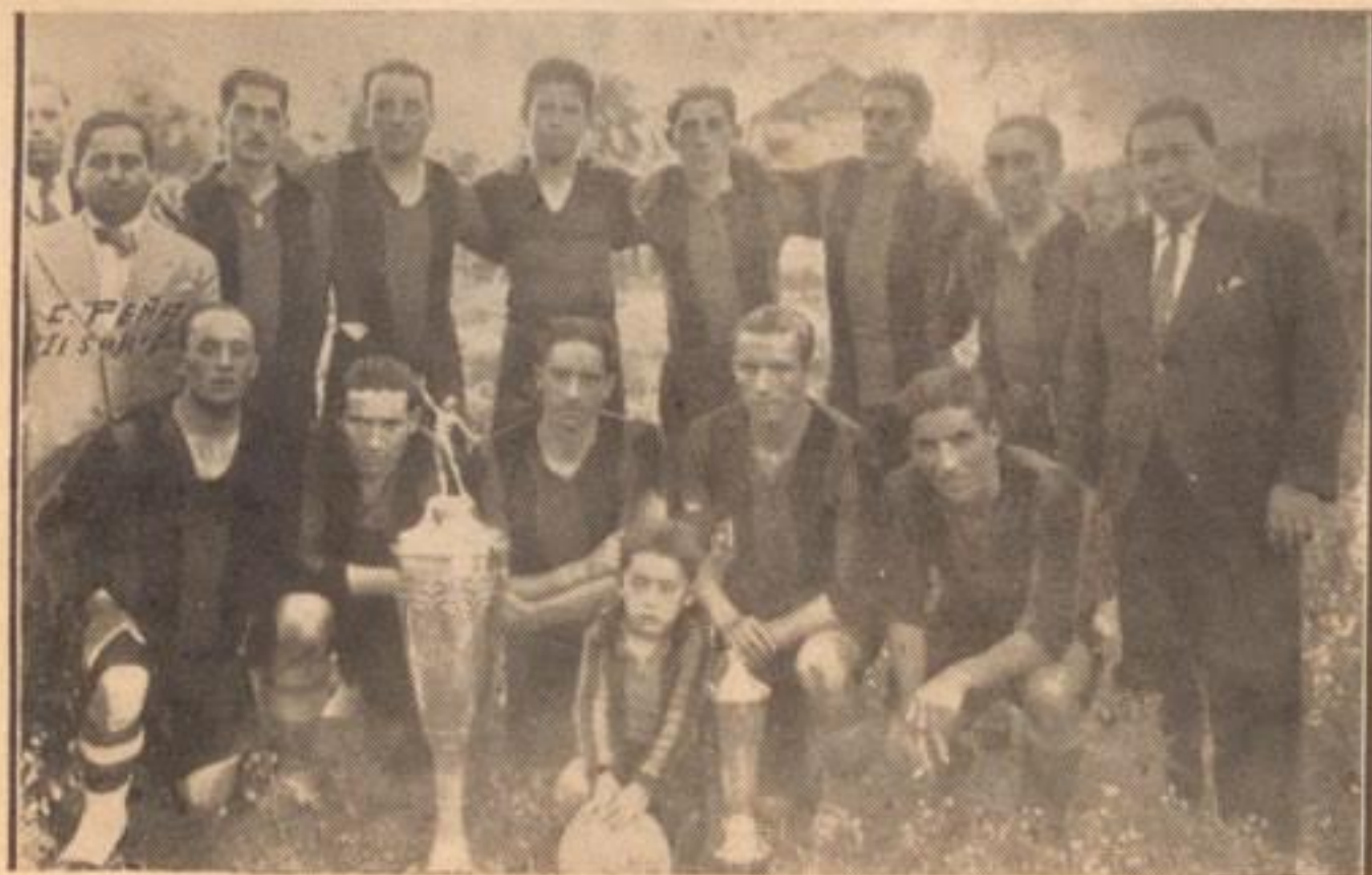
PRIMER EQUIPO DEL FERNANDEZ VIAL

Este desempeño de los viales se ha hecho renacer las esperanzas y el cariño por su club de muchos viejos vialinos que supieron de un Vial airoso y guapo, temible y respetado, que se pasó