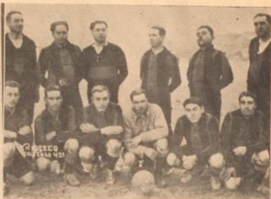
LOS "ALMIRANTES" DEL F. VIAL