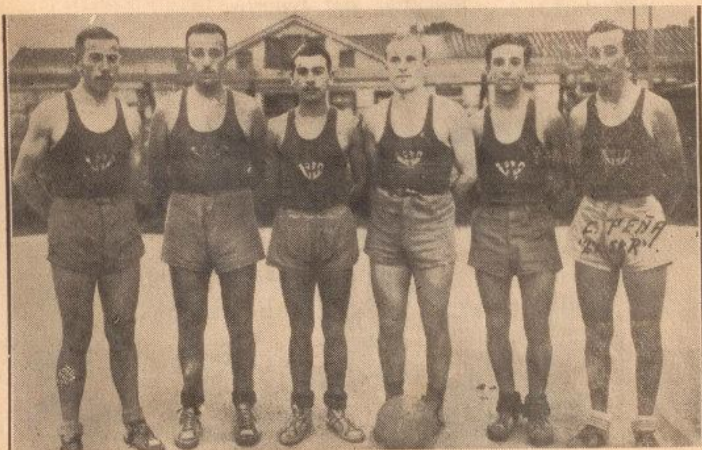
EQUIPO DEL COCHRANE, CAMPEON DE LA DIVISION DE HONOR

Cochrane y hasta sus basquetbolistas, nuestras felicitaciones muy sinceras y nuestros deseos, también muy sinceros, de que durante muchos años más sigan ostentando el título que ahora poseen y que adquirieron merecidamente tras ruda labor, dándole con él un nuevo galardón a su prestigiosa institución.