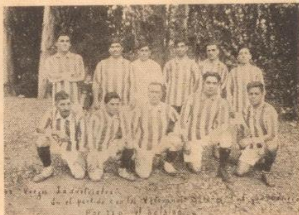
LOS "VIEJOS" INDUSTRIALES