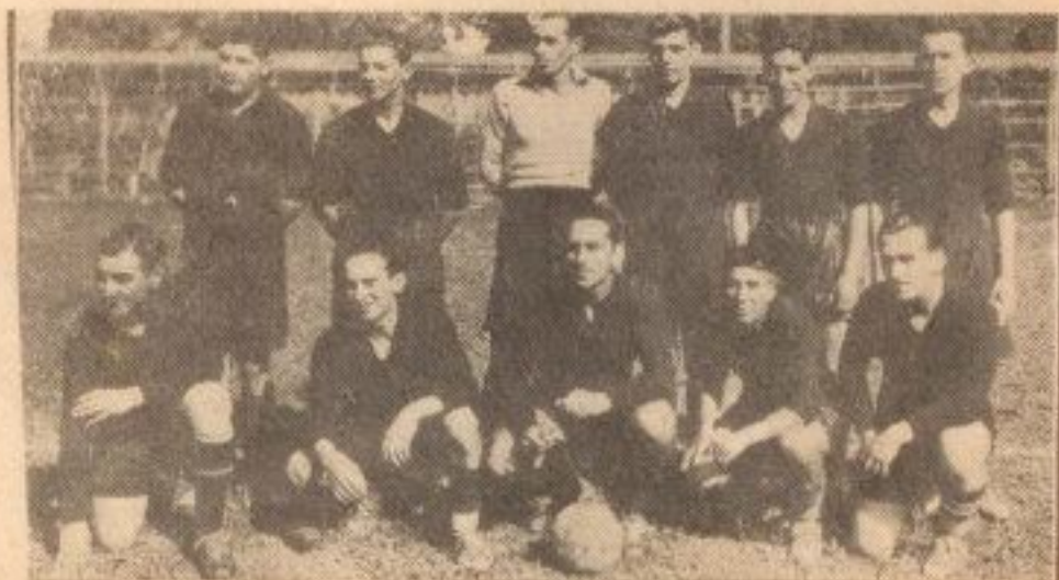
EL TEAM DE FUTBOL DE LA FCA. PASOS CONCEPCION

Pero, si meritorios son estos triunfos de los viales inferiores, como pudiéramos llamarlos, mucho más lo es el último de ellos, el de sexta división, que fue ganado por el equipo "Almirantes", constituido por jugadores viejos del Vial, de esos que ya hicieron su época, pero que con ejemplar disciplina y entusiasmo, siguen defendiendo como muchachos su casaca. Varios de esos "Almirantes" fueron, años atrás, integrantes del primer equipo vialino y ahora, que no cuentan con la juventud ni con el vigor de aquel tiempo, han buscado en las categorías bajas su "acomodo". En 1935, en que el club hizo una temporada desastrosa, ellos, los "Almirantes", le dieron el único campeonato que obtuvo: el de séptima división. Y el año pasado, recién terminado, en que Vial sacó