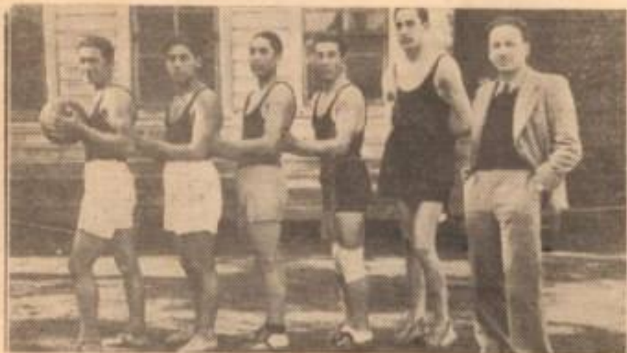
EQUIPO DE BASQUETBOL DE LA FCA. PAÑOS CONCEPCION

El Industrial, por intermedio de sus equipos denominados "Cerveceros" participó también en esas competencias correspondiéndoles a todos ellos una destacada actuación.