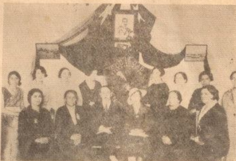
ECOS DE LA INAUGURACION DEL SALON SOCIAL DE LA SOC. PROTECCION DE LA MUJER "P. DE VALDIVIA"

Al felicitar a los dirigentes de nuestro querido club por su acertada dirección en el desarrollo in-