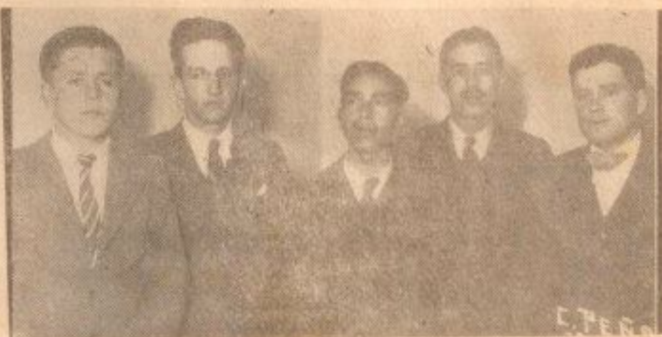
INDUSTRIAL A, QUE OCUPÓ EL 2.º LUGAR

De los partidos efectuados, hubo muchísimos que tuvieron un refido y brillante desarrollo, y que fueron presenciados por una concurrencia que hacía estrecho el lugar de su realización, la cual no escatimó sus aplausos y sus veces de aliento ante las magis-