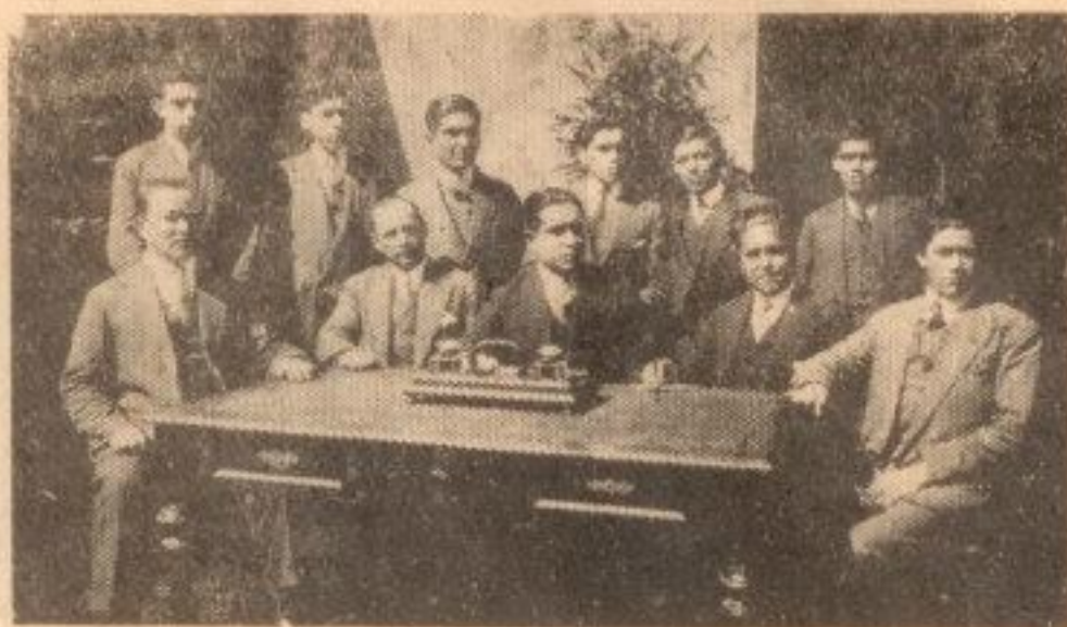
UNO DE LOS BUENOS DIRECTORIOS QUE HA TENIDO EL INDUSTRIAL

triumfalmente por casi todas las canchas del país.