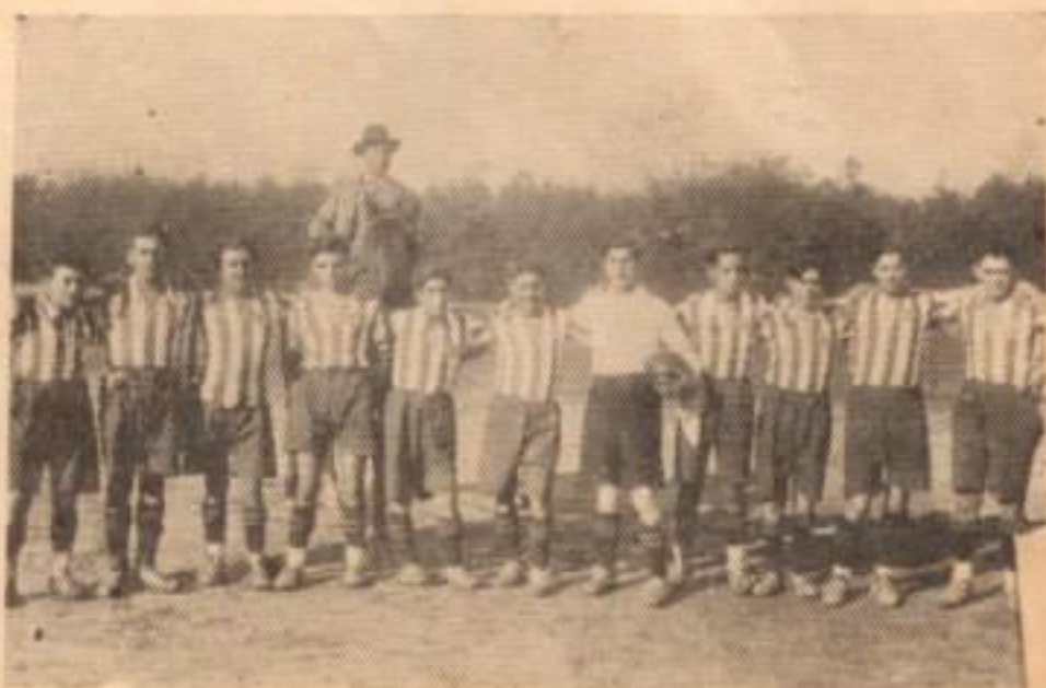
(EQUIPO DE INDUSTRIAL (CERVECERO A), QUE OCUPÓ EL 2.º LUGAR DE LA 2.ª DIVISION EN LA TEMPORADA DE 1936