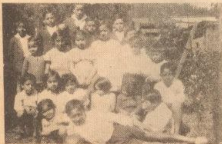
GRUPO DE SOCIOS Y SOCIAS INFANTILES DEL INDUSTRIAL