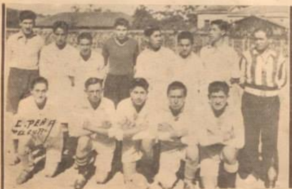
SELECCIONADO JUVENIL DE TALCAHUANO