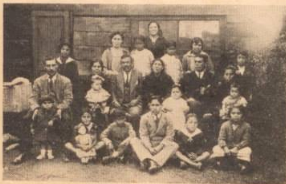
LA FAMILIA MUSOZ ABRIAGADA QUE PERTENECE INTEGRA AL INDUSTRIAL.