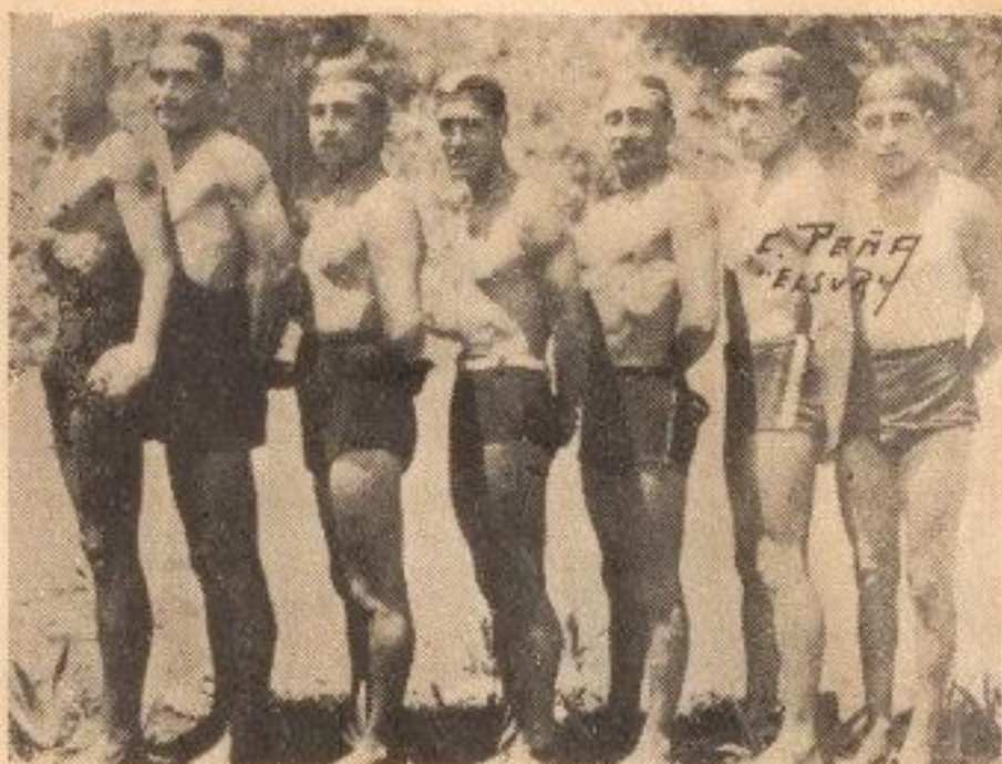
EQUIPO DE WATER-POLO DEL J. UNIDO

Después de lo dicho, no es de extrañar que la mayor parte de los mejores nadadores de nuestra ciudad pertenezcan al Juvenil Unido y que su equipo de water-polo sea el mejor de Concepción, sin discusión alguna.