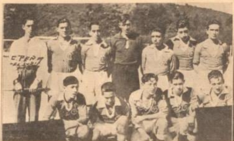
LA SELECCION JUVENIL DE CONCEPCION

Mientras nuestro seleccionado infantil empató con el del puerto, los juveniles locales derrotaron en dos oportunidades, brillante y merecidamente, al cuadro de igual categoría de Talcahuano, demostrando condiciones magnificas que no han pasado desapercibidas pa-