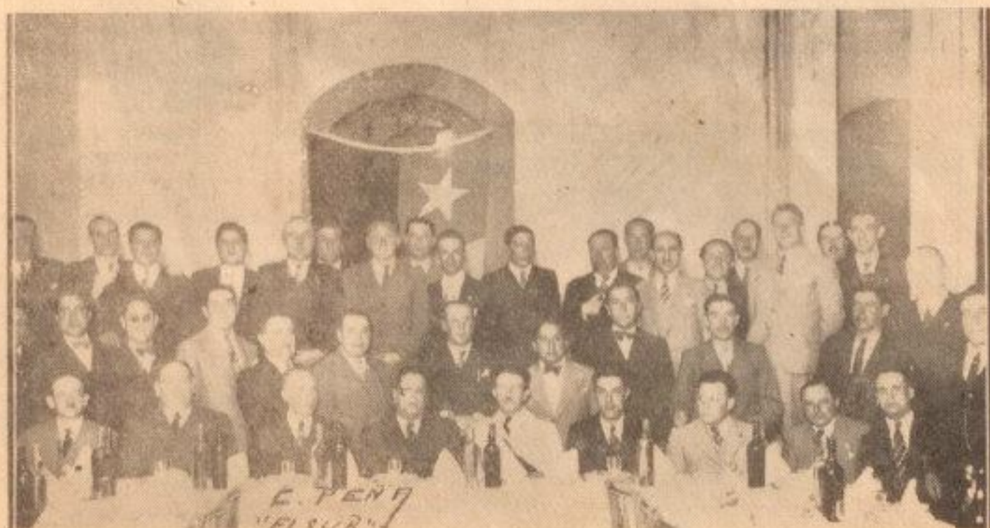
ASISTENTES A LA COMIDA EFECTUADA EL "DIA D EL DEPORTISTA"