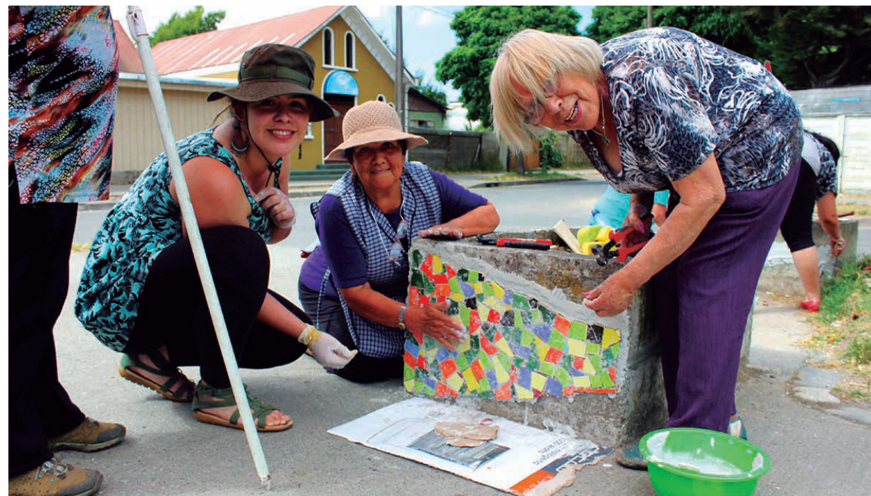
Arriba: Taller de Mosaico. Abajo: Exposición de fotografía.