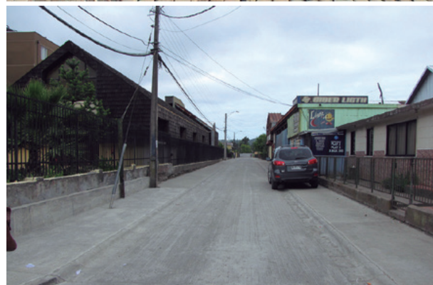
Pasaje Juan Calvino, antes y después.