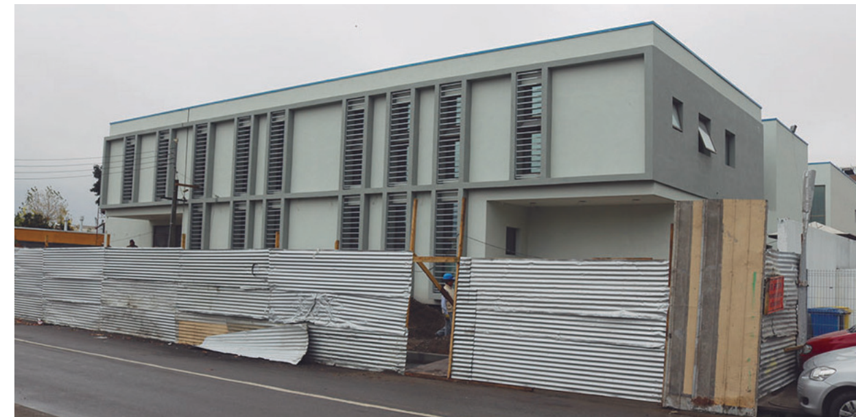
Cesfam en ejecución.

7. Diseño y construcción Centro de Salud Familiar (Cesfam).