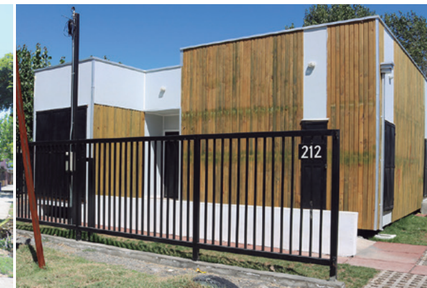
Izq.: Sede El Aromo. Der.: Sede Riviera Biobío.