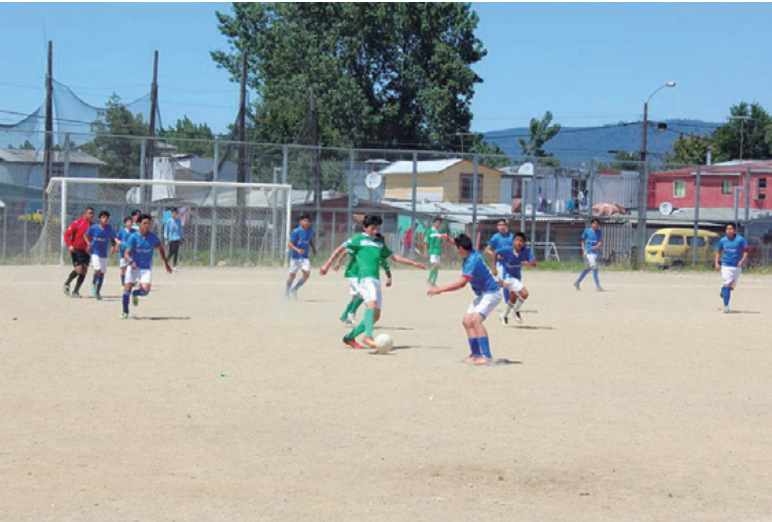
>> Celebración Día del Niño. Entrega de indumentaria deportiva.