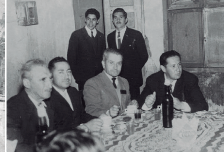
Izq.: Directorio de la Sociedad de Socorros Mutuos del Hombre Pedro de Valdivia. Der.: Integrantes de la Sociedad de Socorros Mutuos compartiendo una cena de honor.