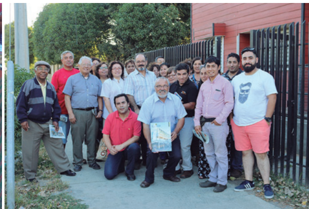
Izq.: Taller de Mosaico. Der.: Agrupación de Organizaciones Sociales de Pedro de Valdivia (AOS).

Así se implementó el torneo “Futuros Campeones de Pedro de Valdivia Bajo”, actividad enfocada en los niños del barrio. Los tres equipos pertenecientes al sector: Industrial, Domingo Antonio Tapia y Armando Riffo, fueron convocados a preparar sus ligas infantiles -“Primera” y “Segunda Infantil”- para competir por el primer lugar del desafío deportivo, pero también para recrearse y establecer una instancia en que tres significativas organizaciones de sectores distintos del barrio y sus hinchas ponderan la pertenencia a un lugar común, a través de una actividad que puso a prueba la habilidad y destreza de los niños. Armando Riffo se impuso en ambas categorías. “Ojalá se repita” era una de las frases que más se escuchó en la cancha “Tapia-Riffo”, ubicada en calle Rancagua.