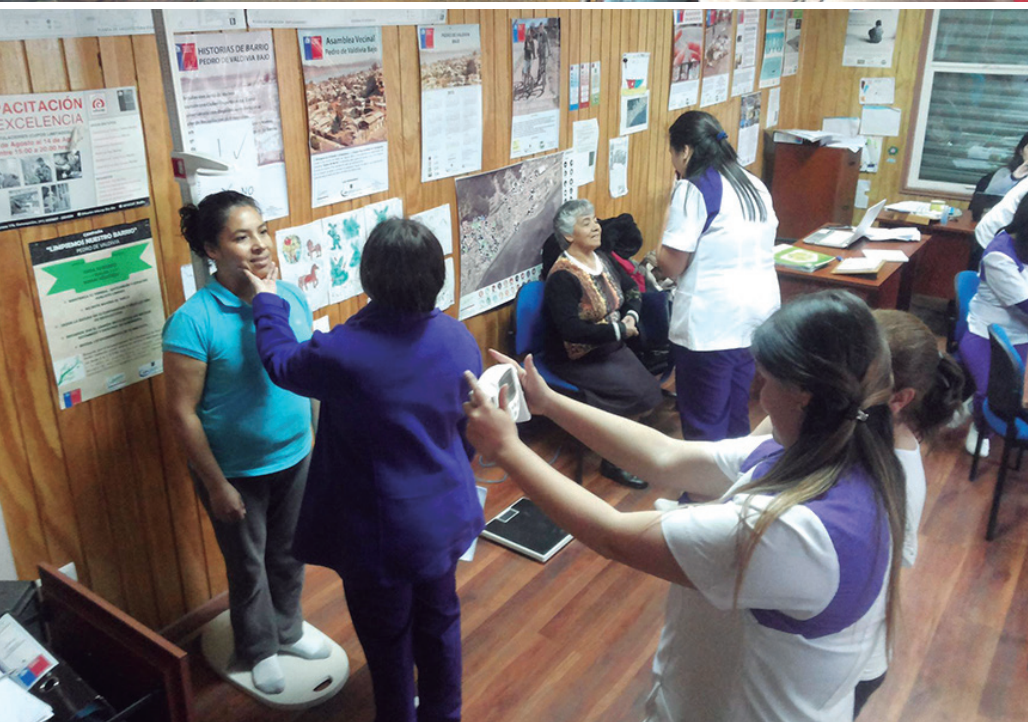
Arriba: Operativo médico gratuito. Izq.: Evaluación clínica del equipo de Nutrición y Dietética Inacap.