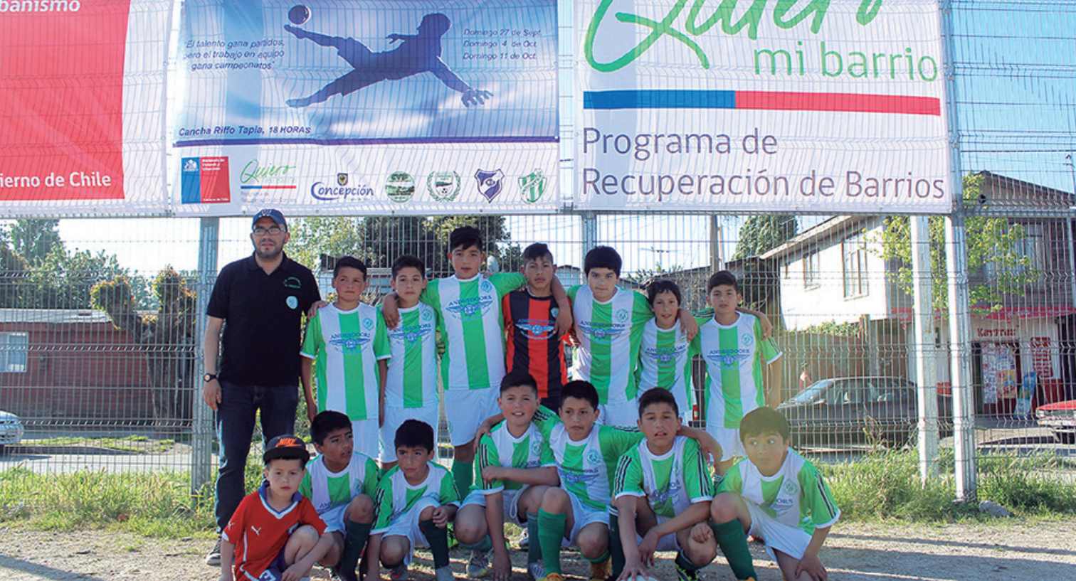
Campeonato de fútbol infantil.