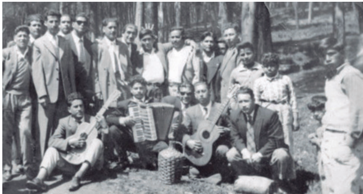
Conjunto Los Riberanos.