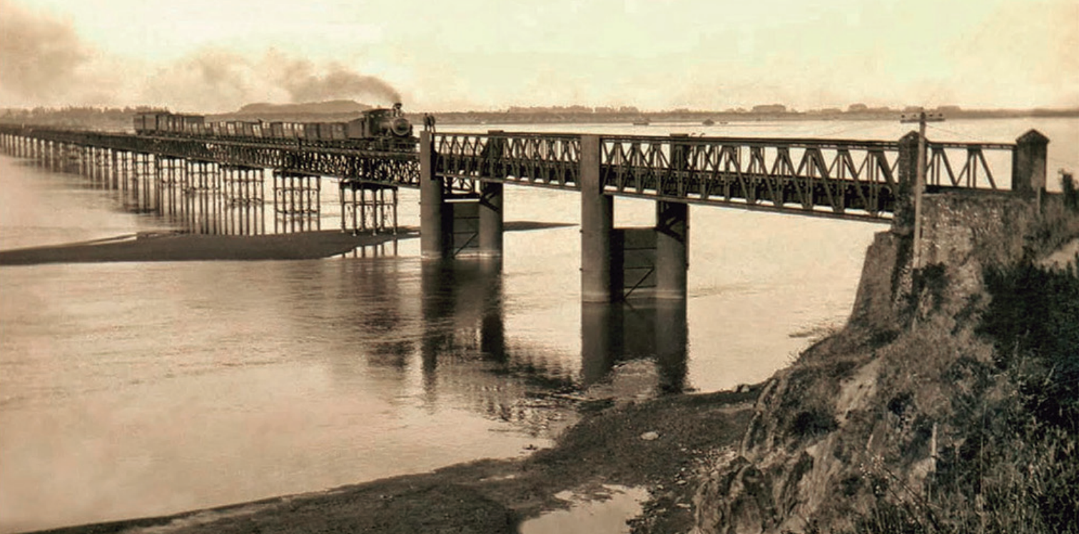
Tren ferroviario cruzando el Biobío.