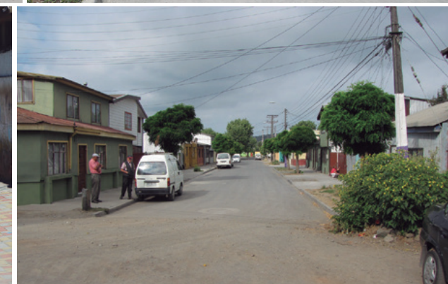
Arriba: Calle Errázuriz Sur, Calle Balmaceda. Centro: Calle Arrau Méndez, Calle Rancagua. Abajo: Pasaje Alemparte, Calle Las Delicias.