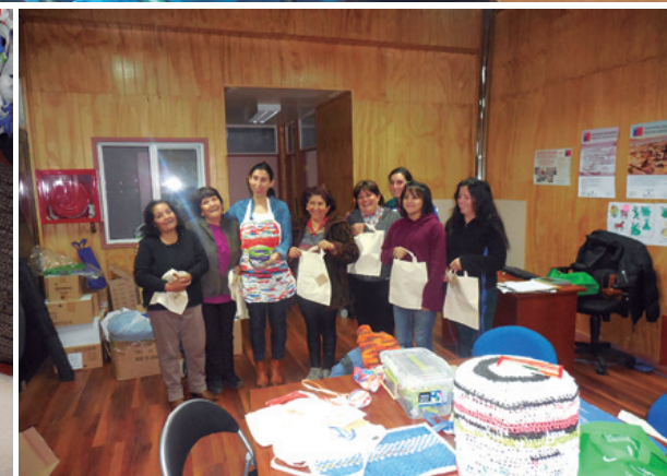
Arriba: Charlas de seguridad intrabarrial Abajo: Grupo "las Tejedoras" en taller de reutilización de bolsas plásticas.