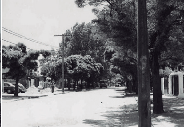
Izq.: Las primeras casas a la orilla del río. Der.: Avda. Pedro de Valdivia, década de 1960.