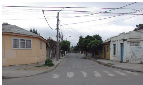
Calle Luis Acevedo.