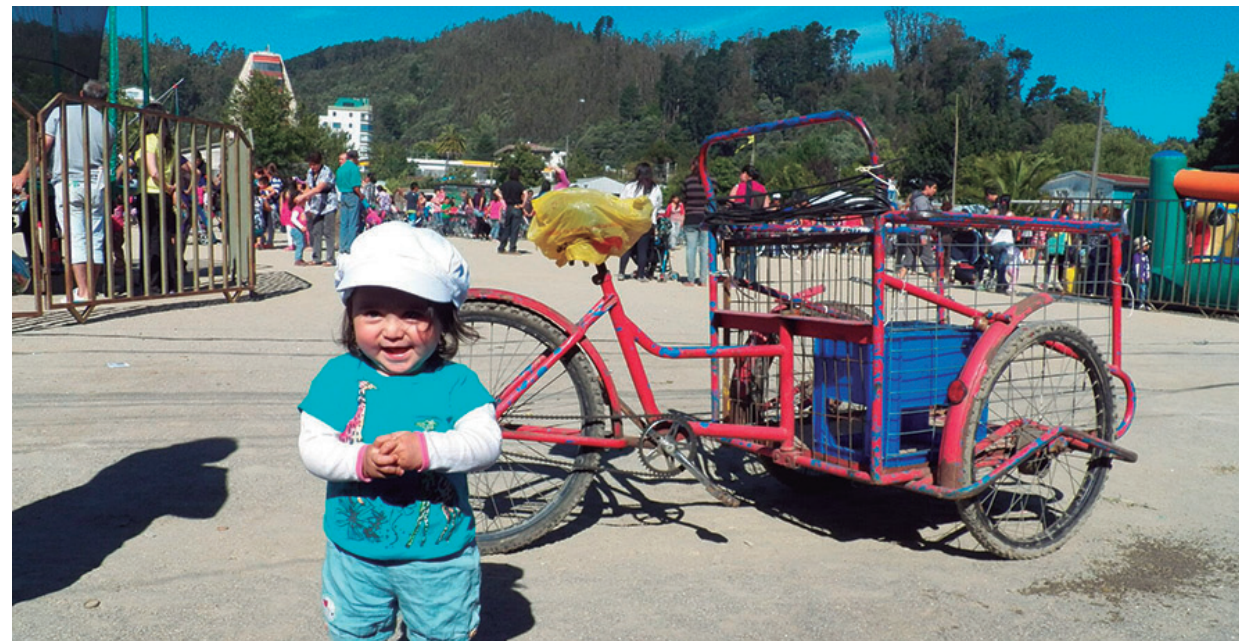
Celebración de la Navidad.

Además de las actividades descritas se desarrollaron otras iniciativas que fomentaron la participación vecinal y el buen uso y cuidado de los espacios públicos y equipamiento comunitario. Entre ellas figuran Cicletadas Familiares, con el propósito de generar conciencia de la transformación del sector,