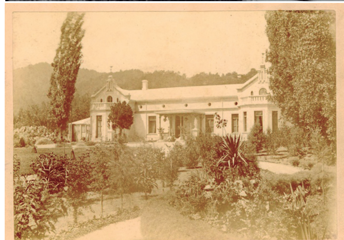
Quinta Junge, año 1906.