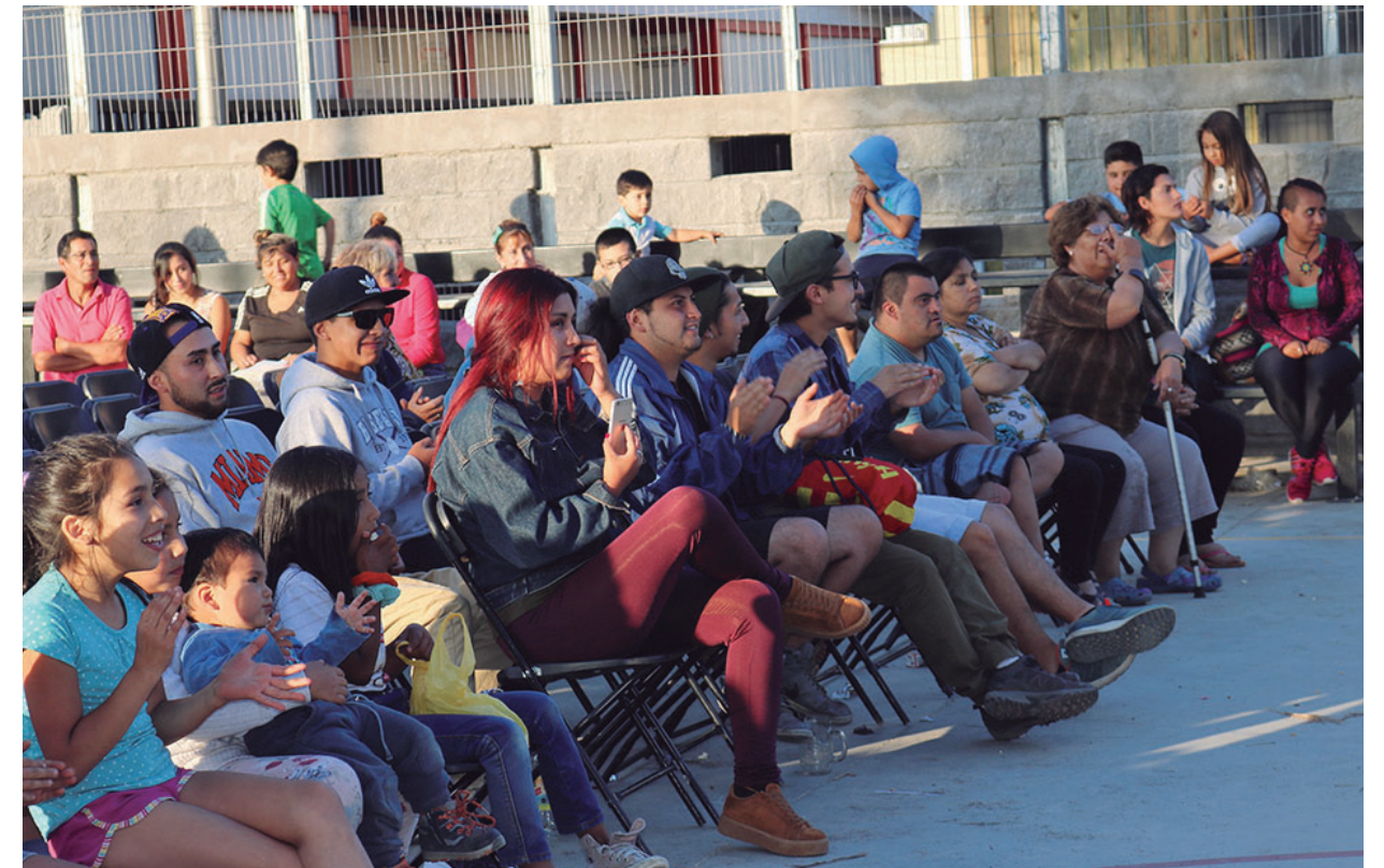
Festival de la Voz.

La actividad se enmarcó dentro de la iniciativa “Cine en tu Barrio”, y fue replicada en Lo Méndez, Lo Custodio y El Golf. El propósito de llevar el