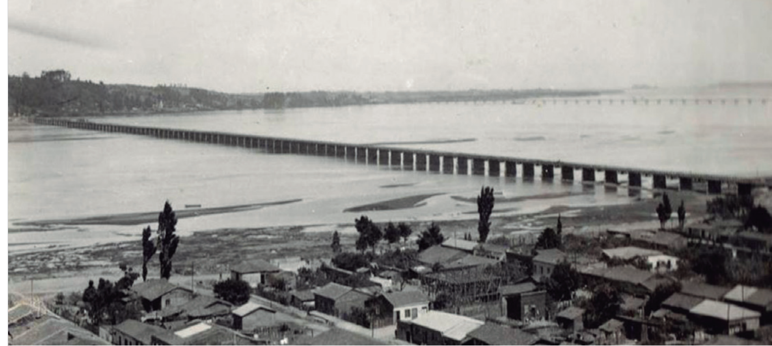
Vista de Pedro de Valdivia y el puente carretero.

Fue así como Pedro de Valdivia termina siendo un asentamiento irregular, que presenta casas y edificaciones de autoconstrucción, por lo que no tienen ningún patrón o característica similar. Es una población de alta densidad, que todavía, en muchos sectores, carece de servicios básicos como el alcantarillado.