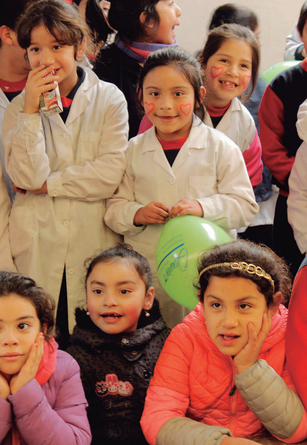
<< Celebración Día del Niño.