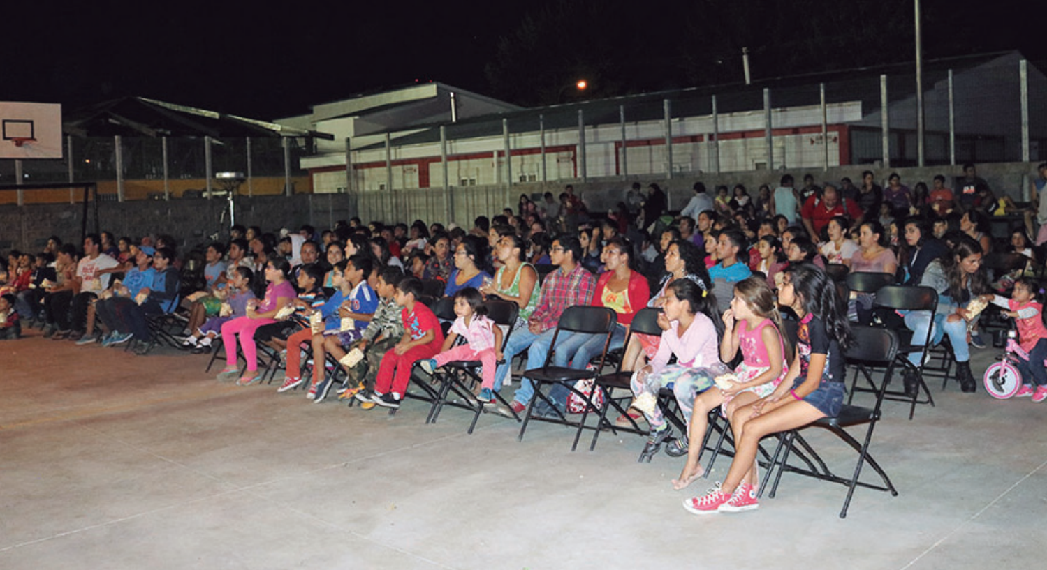
Cine en tu Barrio.

Alrededor de 20 dirigentes pertenecientes a diferentes organizaciones con personalidad jurídica vigente de Pedro de Valdivia Bajo se dieron cita para firmar ante la ministra de fe, con el objetivo de protocolizar el procedimiento de constitución de la mencionada directiva.