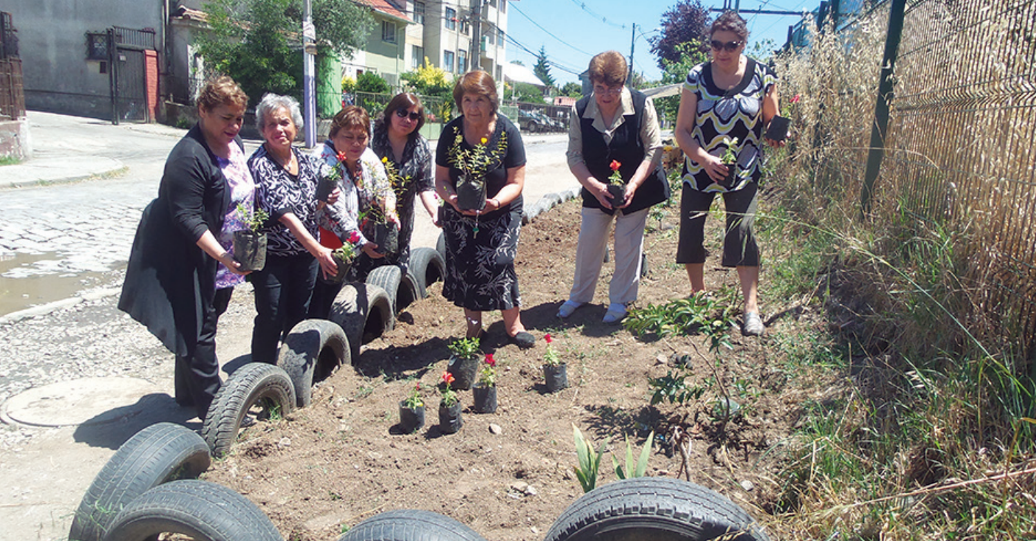
Campana de arborización.

chamente vinculadas al mejoramiento de la imagen del barrio y la higiene ambiental comunitaria. Se ejecutó una campaña de tenencia responsable de mascotas, hubo charlas y operativos de saneamiento de perros, desparasitación y control de garrapatas, campañas comunitarias de control de plagas, realización de charlas y talleres de manipulación de productos para control de plagas, campaña de desratización, entrega de productos químicos por casa, campañas de “descachureo” en el sector, limpieza de fosa séptica, pozos negros, y desratización y esterilización de mascotas, entre otras actividades.