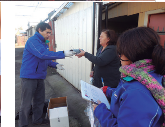
Arriba: Taller infantil de huertos en colaboración con el Colegio Alonso de Ercilla. Abajo izq.: Esterilización de mascotas. Abajo centro: Desparasitación de animales Abajo der.: Entrega de insumos para desratización.