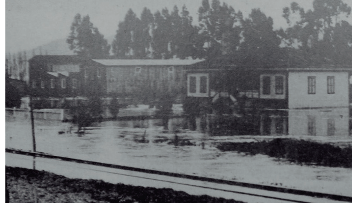
Gran inundación de Pedro de Valdivia en 1899.