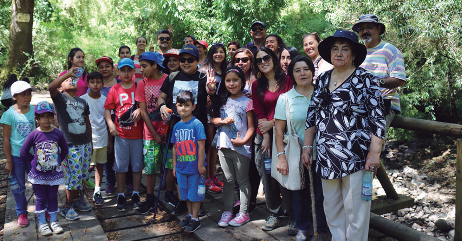
Visita a Reserva Ecológica Nonguén.