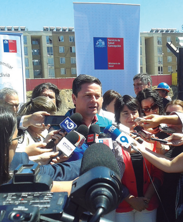
Alcalde (izquierda) y Seremi (derecha) durante la Colocación de la Primera Piedra.