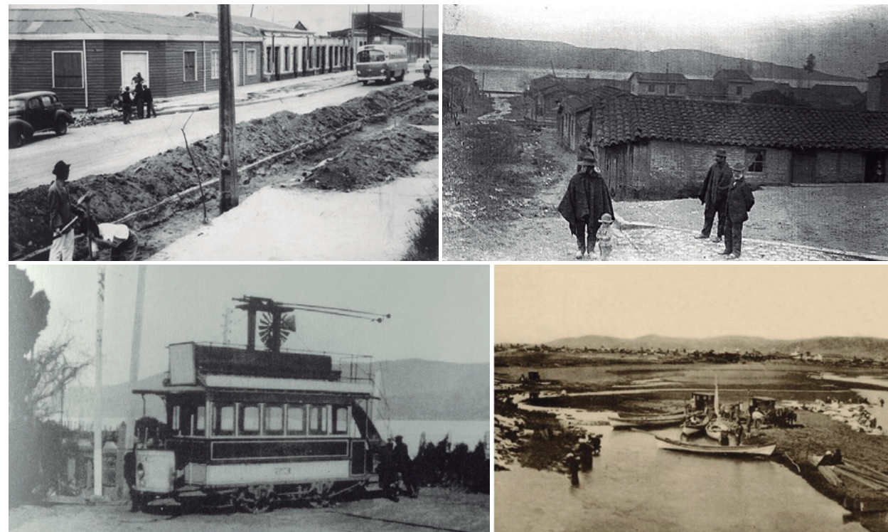
Arriba izq.: Avda. Pedro de Valdivia, altura del Sindicato CCU. Arriba der.: Calle Sargento Aldea, donde hoy está la entrada desde el Sanatorio Alemán, década de 1920. Abajo izq.: Tornamesa del tranvía ubicada en Avda. Pedro de Valdivia con calle Sander. Abajo der.: Las barcazas que en los primeros años cruzaban a los habitantes de una orilla a otra del río, 1945.

“Utilizada históricamente como una vía de comunicación entre los pueblos de la ribera norte del Biobío y la ciudad de Concepción, la zona en cuestión fue adquiriendo progresiva significación desde la segunda mitad del siglo XVIII, cuando en aquel entonces el Gobernador-Intendente de Concepción, Ambrosio O’Higgins, propuso trazar sobre el lugar una nueva