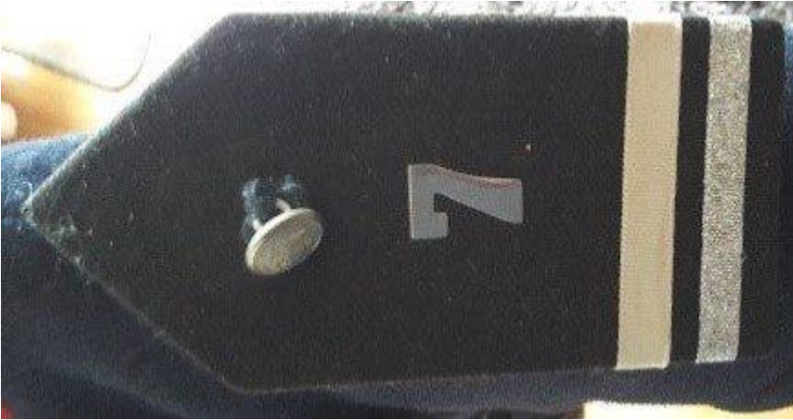
Palas planas de género de Voluntario Honorario.