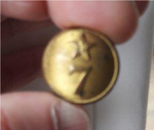
Botón de bronce con N° 7 y Estrella. .