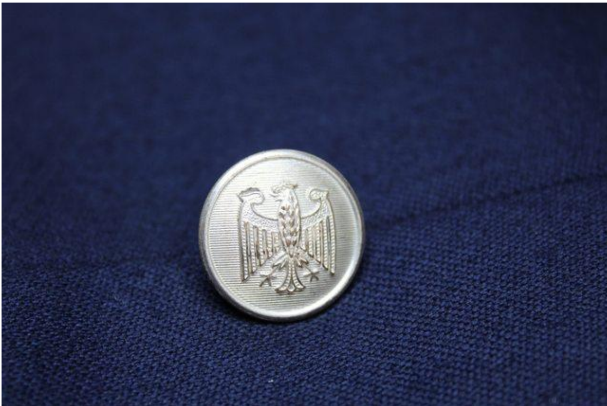
Botón actual.

Actualmente, los botones ya no tienen el 7 y una estrella como otrora, sino que se importan de Alemania por lo que portan un águila alemana, son de color plateado y son los mismos que usa la Feuerwehr alemana.