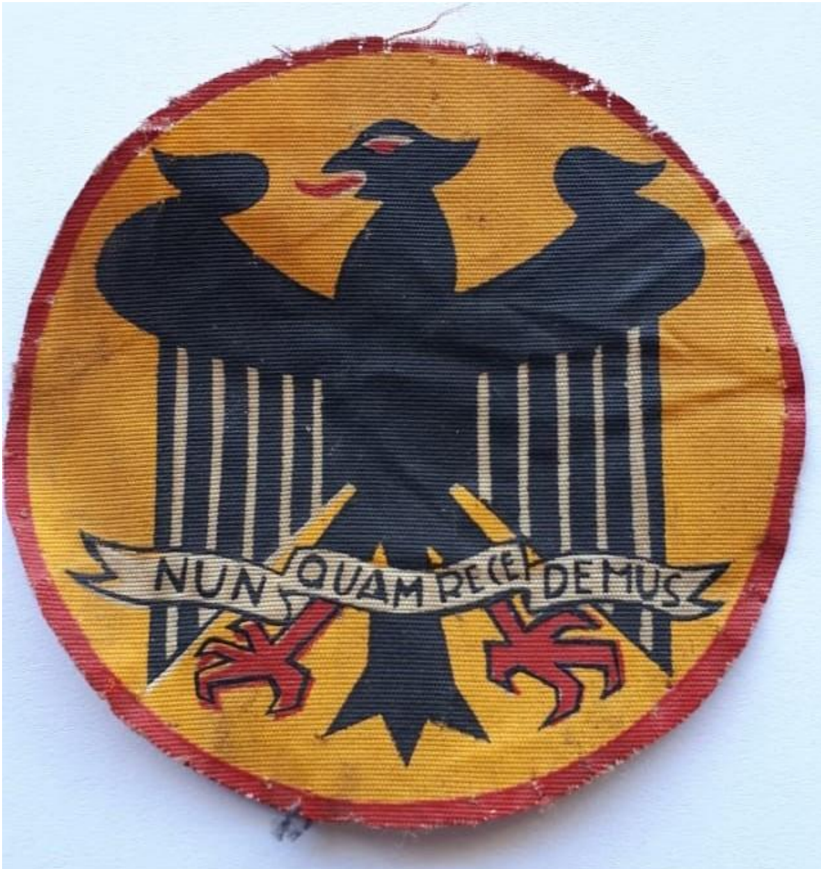
Primer parche diseñado por el Honorario Fernando Cleveland R.