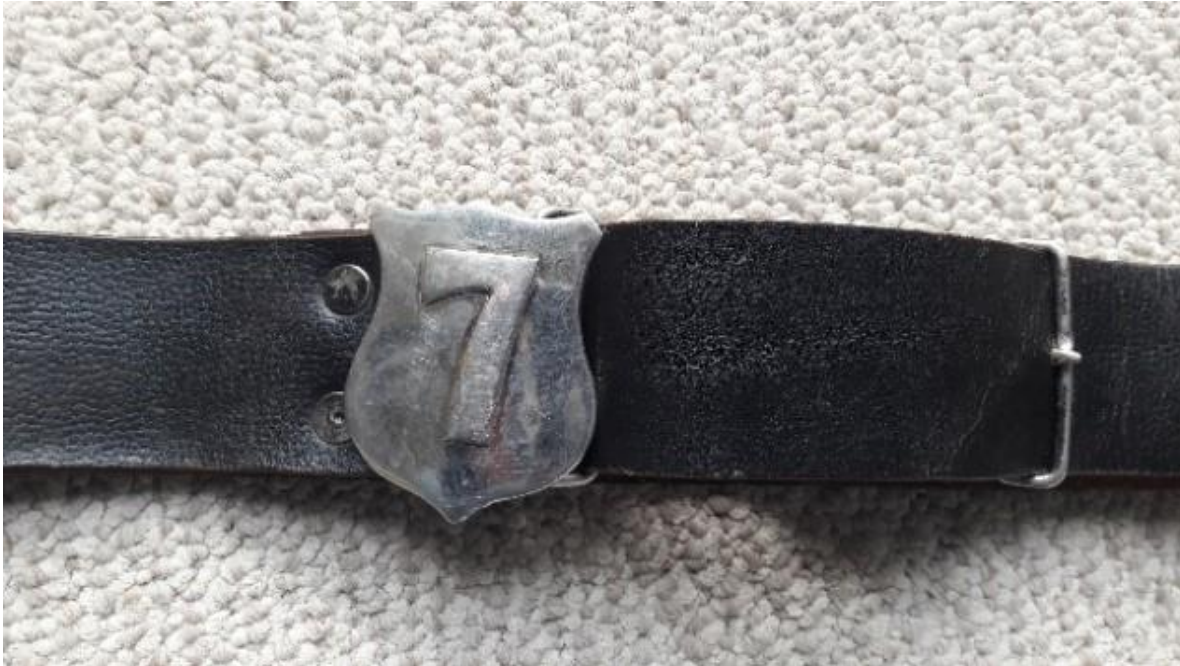
Cinturón con hebilla bronce con N°7.

Los que alguna vez han tenido que limpiar bronces saben que no es fácil y demanda paciencia y trabajo hasta lograr ese brillo y lustre que permite reflejarse en él, por lo que sin duda, el lucir los bronces encandilantes del Uniforme de Parada al sol debe haber sido una gran satisfacción. Así, al menos lo relata en su libro de Crónicas de 50 Años, donde Günther Hohf recuerda que los primeros años de formación de la Compañía no fueron fáciles, cada logro era el resultado de mucho esfuerzo, perseverancia y sacrificios, por lo que es comprensible el orgullo en el relato de 1959 cuando el 21 de mayo, la Compañía se presenta con su Uniforme N°1, de Parada, y Uniforme N°3, de Ejercicio, para la fundación de la 1° Compañía de Bomberos de Yumbel.