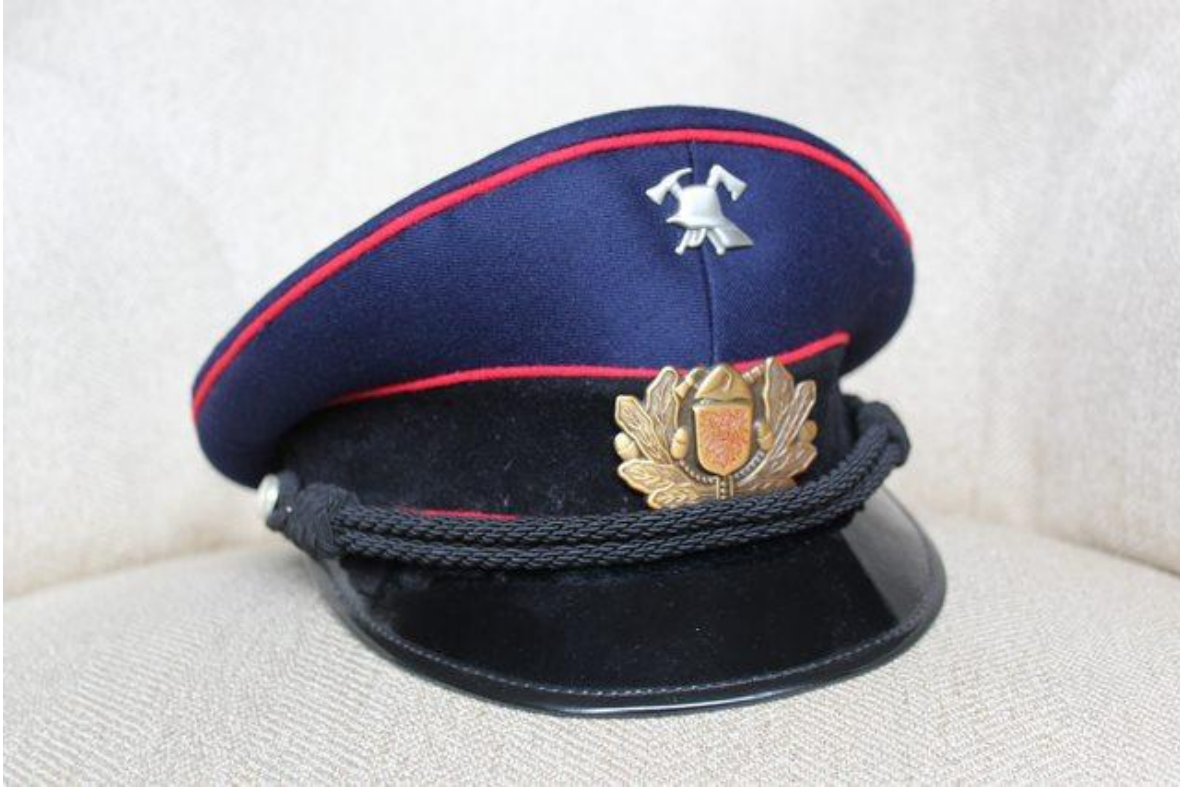
Gorra de Voluntario.

Precisa el Honorario Rojas que la confección del Uniforme de Gala sería adjudicada a la sastrería Militar e incluiría los juegos de pantalones de los Uniformes de Parada y de Gala, y, por primera vez, se considera el uso de un juego exclusivo de colleras de uso exclusivo para Oficiales y Honorarios, importados de Alemania, para las camisas blancas.