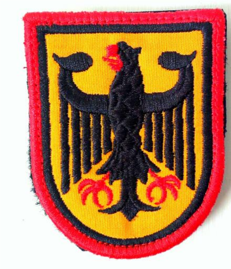
Parche actual del águila imperial. Va en el brazo izquierdo del uniforme de Gala y Parada.

En abril de 1968, la Comandancia impone el uso en la casaca de paño del Uniforme de Parada de una insignia con el nombre de la ciudad, en nuestro caso, con la palabra “Concepción” en la manga bajo la costura del hombro izquierdo, distintivo implementado a nivel territorial con el nombre del Cuerpo de Bomberos correspondiente a la Compañía, lo que permitía distinguirse entre las Compañías y Cuerpos de Bomberos y que lucían los Honorarios y Voluntario hasta los años 80, cuando comenzó a entrar en desuso.