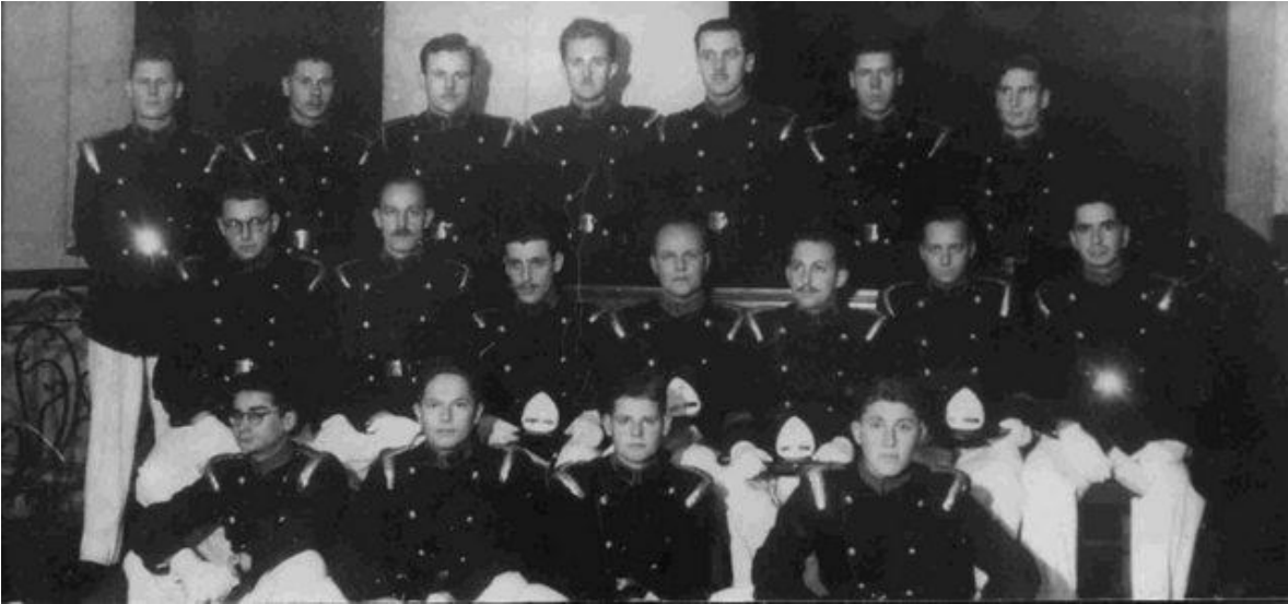
Primer Aniversario de Séptima Compañía de Bomberos en Uniforme N°1.

Aun cuando la fotografía histórica del 1° Aniversario de nuestra Compañía es en blanco y negro, hay detalles que merecen destacarse como es el contraste del cuello sobre el azul prusiano de la casaca. El cuello desde su origen ha sido recto de paño rojo intenso, sin solapa, con sendos 7 de bronce en las puntas; el borde del corte de la casaca cruzada sobre el pecho tiene borde rojo, al igual que el borde de las botamangas en los antebrazos y, tal como puede apreciarse en la imagen, resplandecen los bronces de los botones, de la hebilla del cinturón que era una placa con un 7, y de las charreteras sobre los hombros.