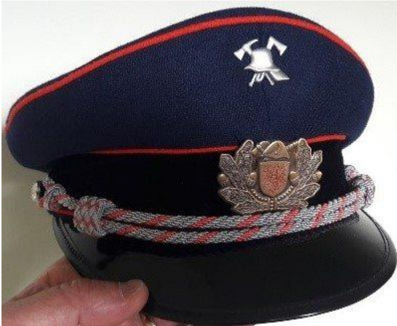
Gorra Honorario del actual uniforme de Gala.