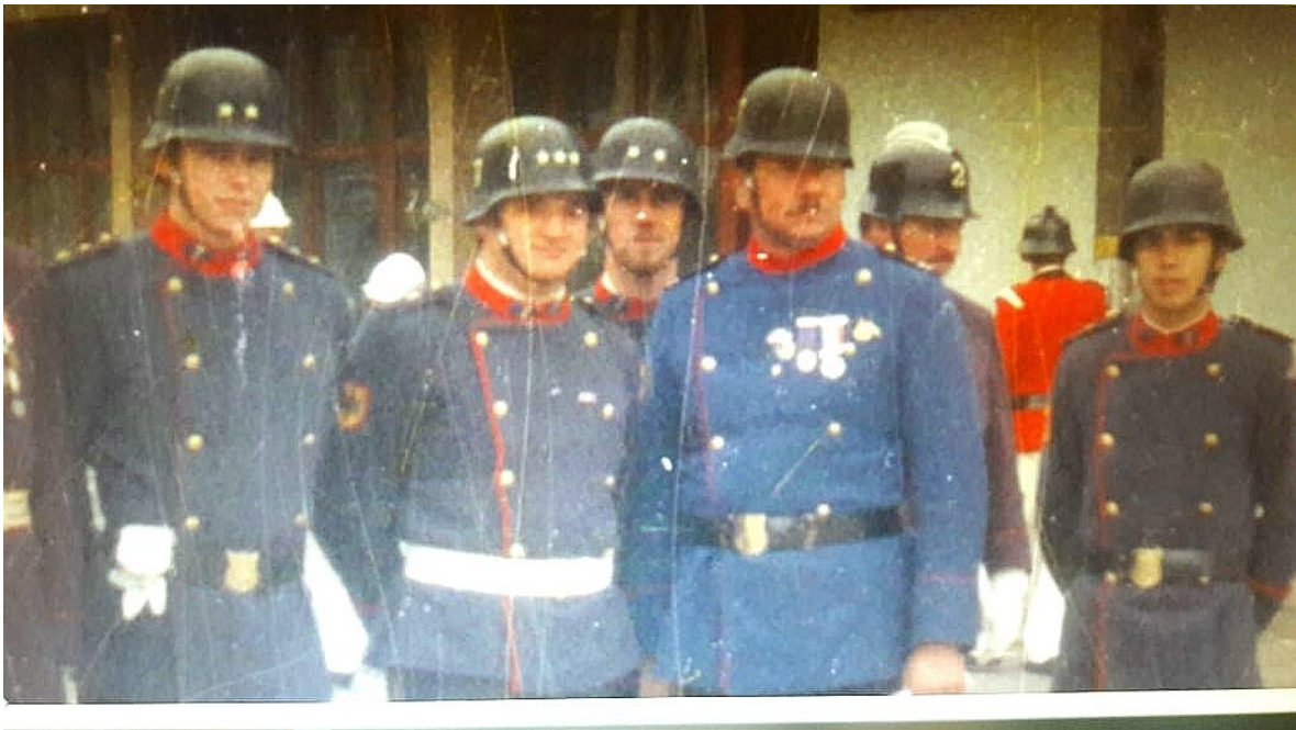
Uniforme de Parada en distintos tonos en 1978.

color a azul oscuro del paño para las casacas del Uniforme de Parada que se compraron un par de rollos en la fábrica Bellavista Oveja Tomé y cada voluntario llevaba la tela a la sastrería Fissore para la confección, según recuerda el Honorario Rodrigo Monsalve. Por lo anterior, muchas fotografías de la época muestran a la Compañía con Uniformes de Parada de distintos tonos de azules, desde azul prusiano a azul oscuro.