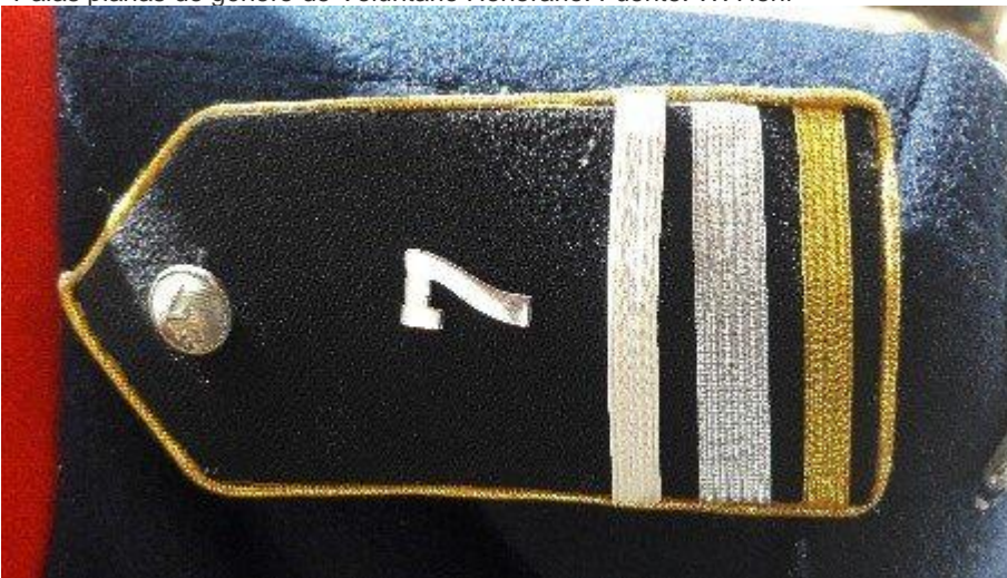
Palas planas de género de Voluntario, Honorario y Director Honorario de Compañía.