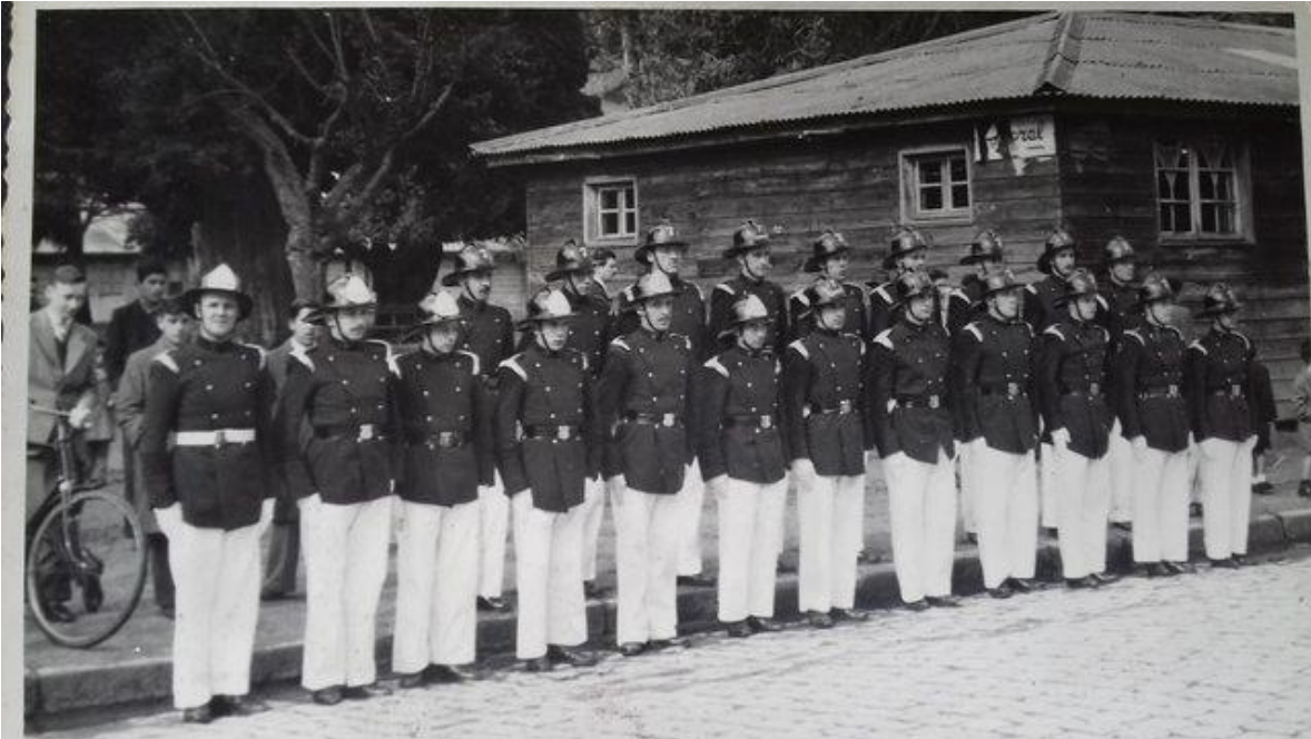
Formación de la Compañía con Uniforme de Gala.

Desde que se formó el primer Cuerpo de Bomberos de Valparaíso (y de Chile) con 4 Compañías en 1851, han sido voluntarios las personas que las han constituido, organizados jerárquicamente, similar a cualquier rama de las Fuerzas Armadas, por lo que resultó natural la adopción y uso de uniformes tanto para el trabajo en los incendios, socorros o emergencias, así como también para las presentaciones oficiales a las que son invitados a participar en las ciudades, vestidos con sus Uniformes de Parada y de Gala, y que el público espera ver y recibirlos con aplausos a modo de retribución y reconocimiento, a su paso marcial.