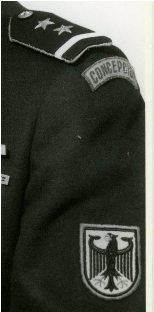
Parche "Concepción" y el parche del Águila característico de las Compañías Alemanas.

Si bien desde 1950 se acordó que la Compañía aportaba el paño para la casaca del Uniforme de Parada, conseguirlo, resultó ser harina de otro costal para la Compañía y cada año costaba más encontrar el tipo de paño, la calidad y el color azul prusiano tan distintivo. Consecuentemente, para 1976 coexistían 2 tonos de azul prusiano en los uniformes, persistía la dificultad de proveedor, por lo que se plantea la alternativa de cambiar el