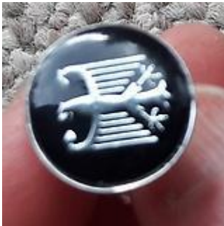
Colleras Uniforme de Gala Oficiales y Honorarios.