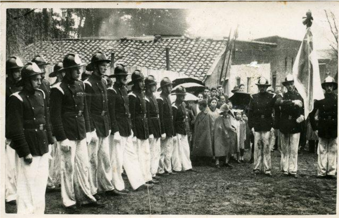
1° Aniversario Séptima Compañía de Bomberos de Concepción.

Voluntarios, en tanto que la oficialidad se distinguía por cucarda blanca en forma de gota con grado y número; el 23 de mayo 1950 se informó que Comandancia entregará los correspondientes cascos, sin costo a los voluntarios, completando el uniforme de la Compañía. Günther Hofh destaca que los cascos entregados correspondían a una partida adquirida por el Cuerpo de Bomberos de Concepción, con lo cual se lograba uniformar con casco americano a todas las Compañías de la ciudad, terminando con la diversidad de cascos en uso.