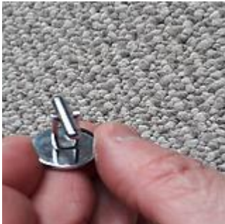
Colleras Uniforme de Gala Oficiales y Honorarios.

Después de repasar la evolución del Uniforme de Parada y de Gala es interesante insistir que los uniformes simbolizan la unidad de todos y cada uno de los integrantes de la Compañía, por sobre la individualidad, pues no sólo se comparte la misión bomberil sino que, al mismo tiempo, nuestras Oficialidades han sabido mantener la identidad particular a través