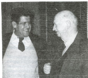
Con el autor de la entrevista Casa del Arte Agosto 1994