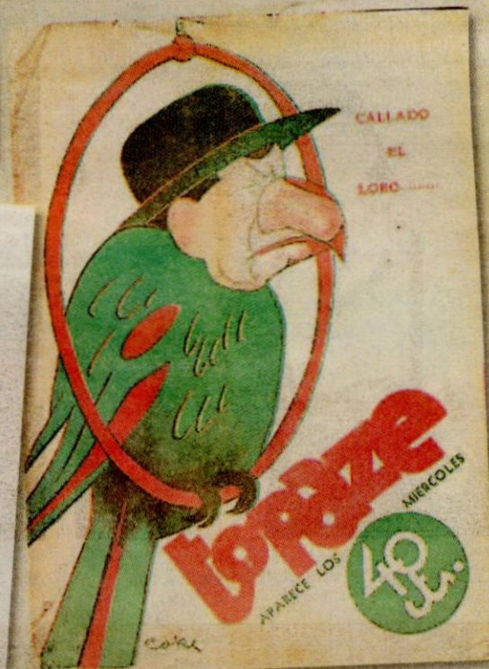
PORTADA DE TOPAZE 50 (1932), Gentileza Claudio Aguilera, Biblioteca Nacional.