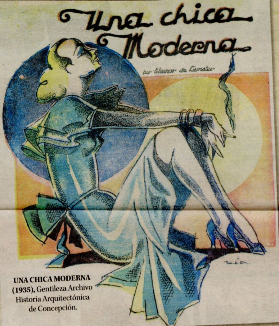
UNA CHICA MODERNA (1935), Gentileza Archivo Historia Arquitectónica de Concepción.

Solo fue a fines de la década del 30 que René Ríos comenzó a firmar como Pepo, pero no de la forma que hoy la conocemos. Solo en los 50 nace la firma que se hizo famosa y que acompaña cada tira cómica del pajarraco. Pese a que Pepo murió el 14 de julio del 2000, la firma continuó apareciendo en la revista y viñetas de diarios como un legado a su memoria y a su talento.