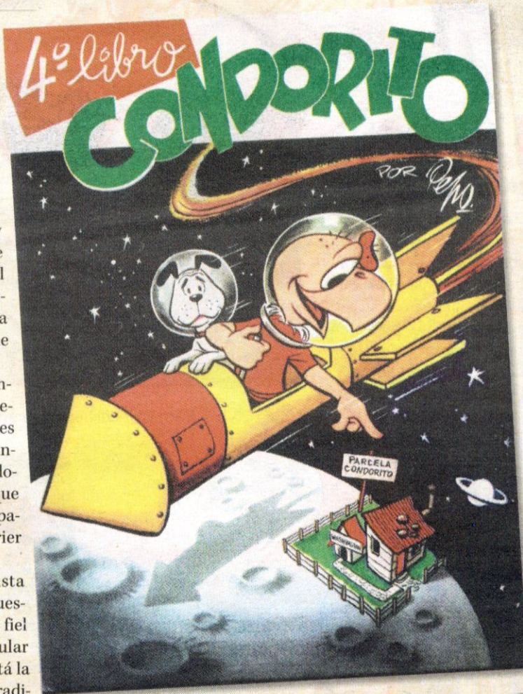
PRIMERO CON WASHINGTON Y LUEGO CON YAYITA