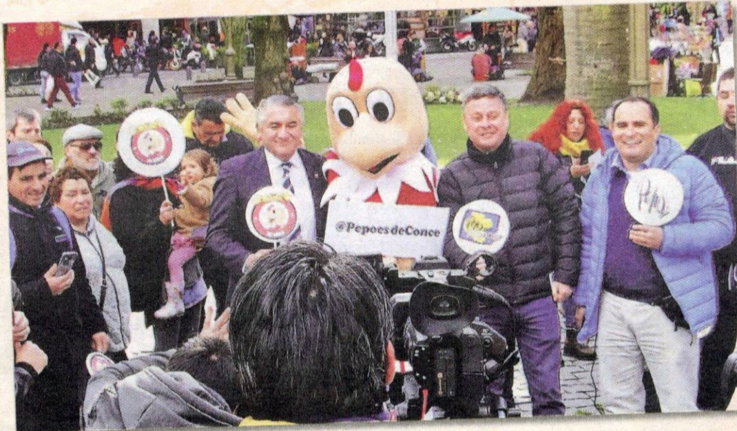
CELEBRACIÓN en Concepción del cumpleaños de Condorito.