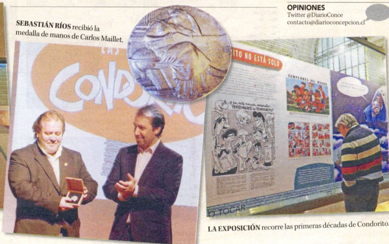
LA EXPOSICIÓN recorre las primeras décadas de Condorito.