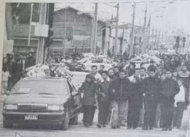
El cortejo marchó como uno solo rumbo al cementerio de Chiguayante. Fueron más de mil 500 personas los que despidieron a sus familiares y amigos.

Familiares, amigos, vecinos y autoridades, acompañaron a seis de las personas que fallecieron trágicamente el martes pasado en Chiguayante. Pese a no haber sido velados todos juntos, sí conformaron un solo cortejo al cementerio.