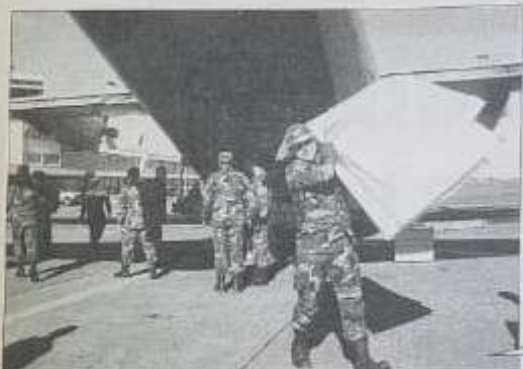
Los "aviones" Hércules repartieron más de 42 toneladas de ayuda para los damnificados. Sin embargo aún no alcanza.