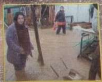
Concepción bajo el agua