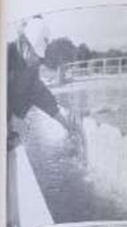
Tanto se asustaron por La Mochita