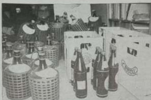
Garrafas de vino y botellas de cerveza fueron encontradas dentro del domicilio que las oficinas de proveedor de droga.