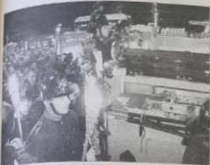
Las grabadoras iluminaron la noche de Chiguayante. Cientos de voluntarios de distintas compañías del país despidieron a los nuevos mártires.