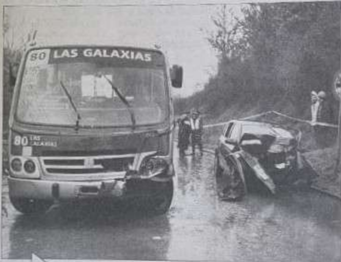
Así quedó el auto en el cual se desplazaba Isabel Contreras. La mujer no resistió el fuerte impacto y falleció en el mismo lugar. En tanto, el bus sólo resultó con daños en su parte delantera.

A este accidente fatal ocurrido en Hualqui, se sumaron sólo colisiones menores en distintos puntos del Gran Concepción.