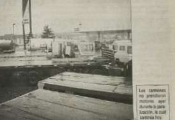
Los camioneros no permiten que las bencineras de la zona operen normalmente. Esto causa pérdidas de millones de pesos para los concesionarios...