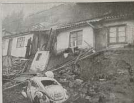
Bellavista presentó las principales dificultades en Tomé.