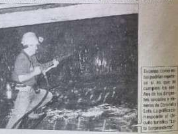
Existen zonas en las que podrían explotarse el carbón, pero la falta de inversión y el costo de explotación hacen que no sea viable...