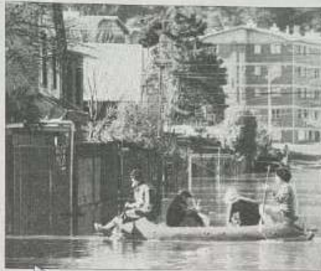
En botes andaban en la Isla Andalién los pobladores.

Por Lily Muñoz y Tania Merino