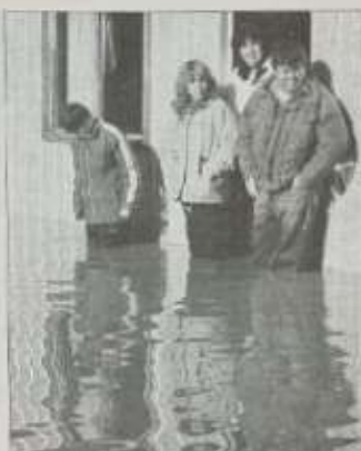
Desde 1972 que la población Pedro del Río Zañartu se inundaba.

llegar y usarlos en caso de que la lluvia amenace su hogar.