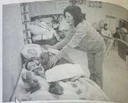
Los mañandras se aprovechan de la escuela en su campaña de albergue.

Y eso no es todo, porque la empresa Soprole hizo un aporte a la intendencia con 20 toneladas de productos, entre los que destacan leche pura, leche con chocolate y agua. Además, Fabelba facilitó 10 mil frazadas para que fuesen repartidas entre los más afectados de la región.