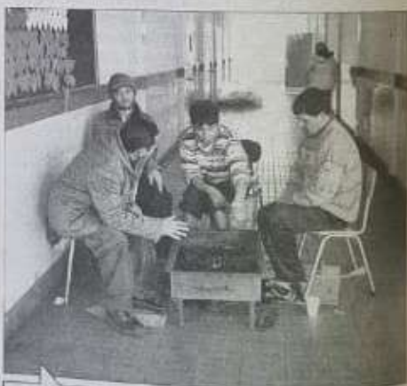
Algunos albergados se encontraban en la escuela Simón Bolívar.

En el tema estructural 40 viviendas quedaron inhabilitables, 119 con daños mayores, pero que aún pueden cobijar a los dueños de casa.