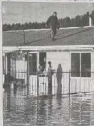
Los habitantes de la Villa Universitaria alegan que las autoridades van a puro mirar el drama, pero que de acción ni faltan.

La ministra de Defensa, tras observar el dolor, dio instrucciones a los mandamases del Ejército y la Armada para que redoblen los esfuerzos de los afectados. Media hora después llegó un vehículo de la Marina con tres motobombas para auxiliar a la gente de Chillanquito.