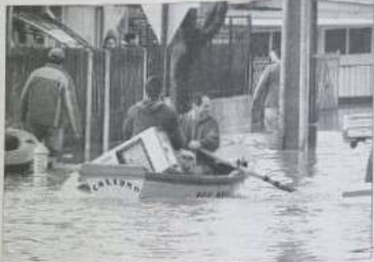
Los vecinos fueron rescatados por los pescadores artesanales de Penco.

En San Pedro de la Paz también se registraron algunas complicaciones en la población Candelaria y los sectores circundantes al estero Los Baños.