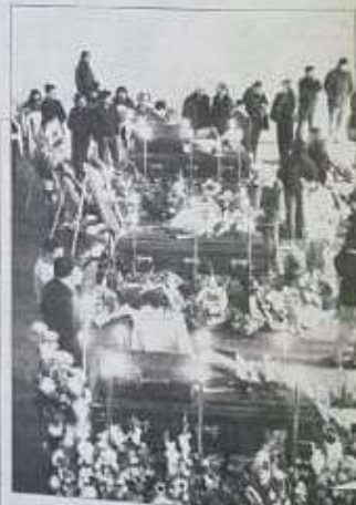
Los tres bomberos caídos en Valle La Piedra de Chiguayante, fueron velados en conjunto en el gimnasio Machasa. La emotividad marcó la despedida.