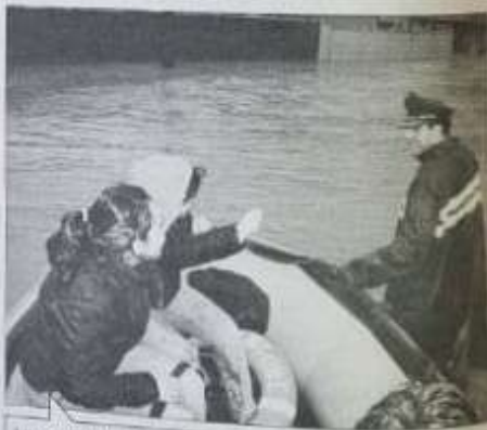
La cosa estuvo fea en Tomé, en donde pobladores tuvieron que salir de sus casas en botes, con la ayuda de Carabineros.

El municipio entregó recursos como la entrega de mangas de polietileno, frías, bolsas de carbón, colchonetas, camas de alimento y planchas de zinc.