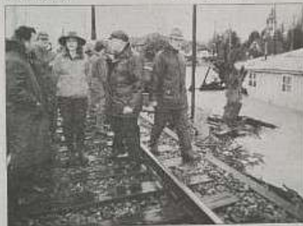
La intendencia se puso al tanto de los problemas en Hualqui