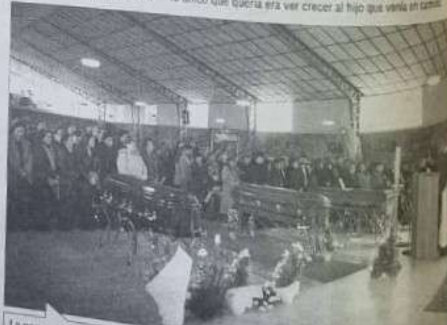
La parroquia San Pablo fue el lugar donde se realizó una ceremonia religiosa para tres de los fallecidos. El templo se repletó de familiares y amigos que les brindaron su despedida.