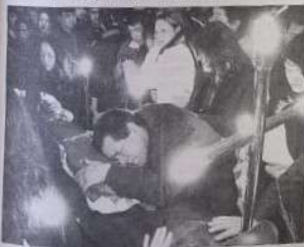
Escenas de profundo dolor se vivieron en la ceremonia preparada para los voluntarios muertos.

Esta despedida se sumó a la ceremonia religiosa y bomberil efectuada en el gimnasio de Machasa y tras la cual Chiguayante lloró amargamente. Es que con el funeral de estos tres ejemplos de vida, efectuado en el cementerio de la comuna, comienza a escribirse una nueva historia para Chiguayante, una que nunca los podrá olvidar y que pide a gritos que nunca vuelva a suceder algo similar.