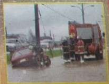
Talcahuano: accidentes y colapso