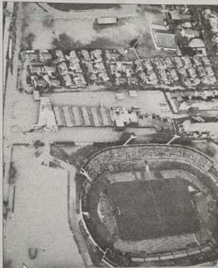
Esta es una imagen aérea que muestra la magnitud de las inundaciones que afectaron al sector Collao de Concepción.

ta Michelle Bachelet reaccionó afirmando que siempre estará donde se produzcan problemas. "Lo importante es que uno esté donde se necesita y que uno vea con sus propios ojos lo que la gente necesita", dijo la mandataria.