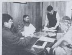
Los dirigentes filiales se reunieron con el gerente de Editorial Los Andes para discutir el día regional de Origenes...