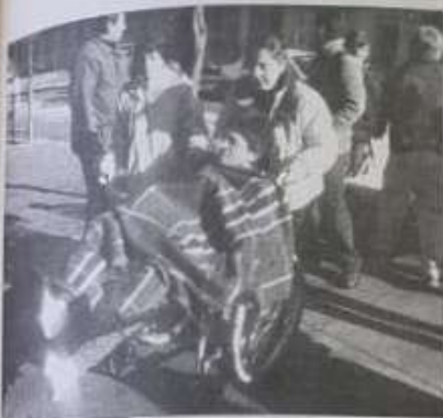
En fuerte apuro se vivió ayer en el Hospital del Trabajador de Concepción a la hora de la evacuación de pacientes.